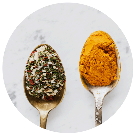
Smaak en balans

Lekkere plantaardige gerechten, en eigenlijk alle lekkere aantrekkelijke gerechten hebben met elkaar gemeen dat de kok aandacht besteedde aan de 5 elementen, namelijk: