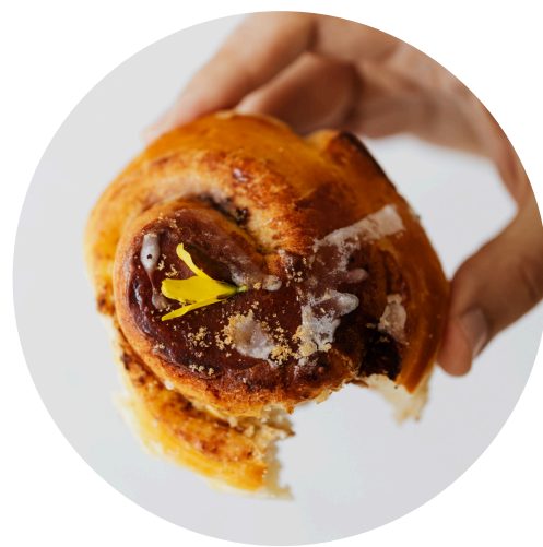
Textuur en beet