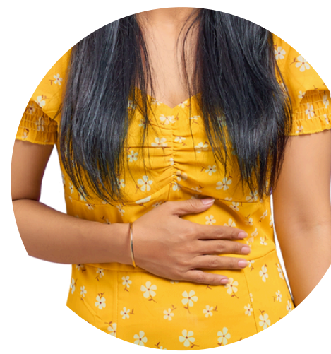
Eiwitten en verzadiging