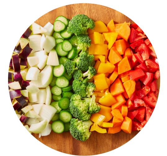
Kleur de regenboog