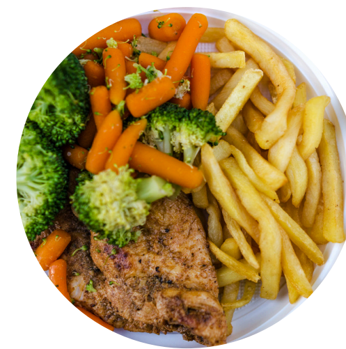
Laat de tripartite los